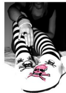
Szabó Orsolya, 1.D

„Az élet rövid, a perc röpké, de vigyázz, mert egy perc alatt egy élet mehet tönkre.”