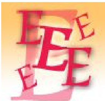
Pálovics Klaudia, 1.E